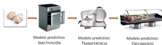
Figura 1. Aplicación de modelos predictivos en varias etapas de producción de un producto cárnico.

Son muchos los factores que afectan el comportamiento de los microorganismos, siendo la temperatura uno de los más conocidos. Otros factores son la actividad de agua, pH, concentración de sustancias químicas (nitritos, por ejemplo), etc. Tanto los microorganismos patógenos como los alterantes se ven influenciados por estos factores, cuya relación se puede cuantificar. La Figura 1 muestra un ejemplo de la aplicación de modelos predictivos, indicando varias etapas en la elaboración de un producto alimenticio.