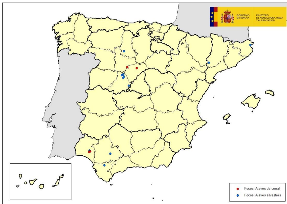
Mapa 3: localización los focos de IAAP detectados en 2022

Si bien hasta el momento no hay constancia de que el subtipo H5N1 que durante los últimos meses está afectando a Europa tenga capacidad zoonótica significativa, es decir, su capacidad de transmitirse a las personas resulta muy reducida, se recomienda minimizar el contacto innecesario con las aves que muestren síntomas clínicos o se hallen muertos en el campo. En cualquier caso, este virus no puede ser transmitido al hombre a través de carne de ave cocinada, huevos o productos procesados derivados de ellos.