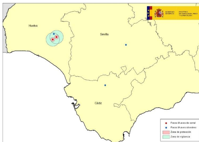
Mapa 1: Localización de los focos en aves domésticas en Huelva (Villarrasa y Niebla)

El primero de los focos confirmado en el día de hoy corresponde a una explotación de pavos de engorde distribuida en cinco naves, con un censo aproximado de 39.500 pollos de 2 meses de edad, localizada en el municipio de Niebla, en la provincia de Huelva (ver mapa 1), que se encuentra en el radio de 10 km (zona de restricción) del foco declarado en la explotación de broilers el pasado 2 de febrero en el municipio de Villarrasa. El municipio de Niebla había sido ya incluido por parte autoridades veterinarias de Andalucía dentro de zona de especial vigilancia por influenza aviar (Anexo III de la Orden APA/2442/2006, de 27 de julio, por la que se establecen medidas específicas de protección en relación con la influenza aviar), zona en la que debido a la situación epidemiológica de la enfermedad en Europa ya se estaban adoptado medidas adicionales para prevenir posibles brotes de la enfermedad en aves domésticas.